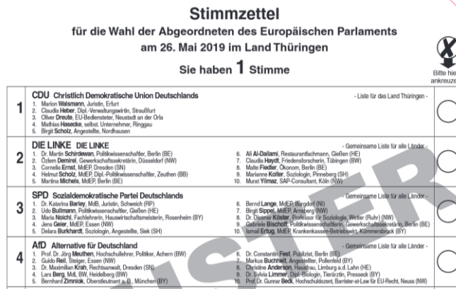
Alter Musterwahlzettel der Europawahl 2019